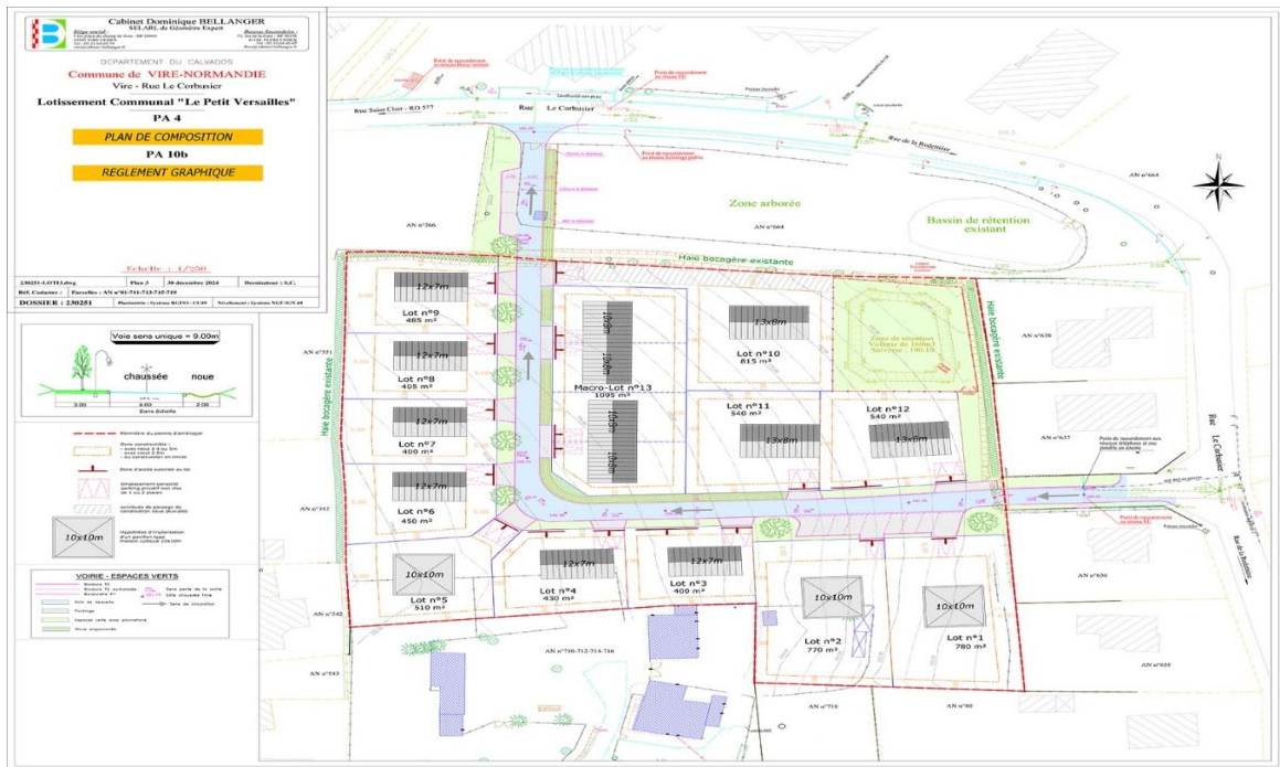
Figure 2 - Plan de composition et règlement graphique extrait du permis d'aménager

L'analyse des offres des entreprises ayant été effectuée, il est donc possible aujourd'hui de déterminer un prix de cession au m 2 pour la commercialisation des lots, sous réserve toutefois de l'avis des Domaines qui seront saisis ultérieurement.