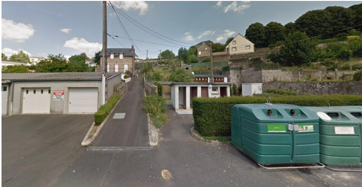
Figure 2 - Un cheminement confidentiel, perturbé par un manque de lisibilité de l'espace "public" adjacent

Accusé de réception - Ministère de l'Intérieur