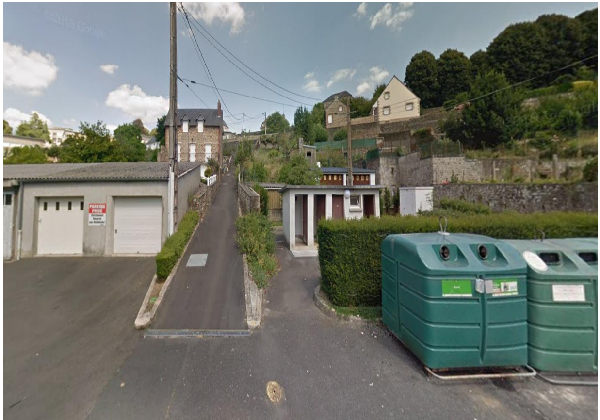
Figure 2 - Un cheminement confidentiel, perturbé par un manque de lisibilité de l'espace "public" adjacent

Accusé de réception - Ministère de l'Intérieur