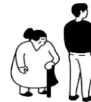
Les personnes en situation de handicap mental