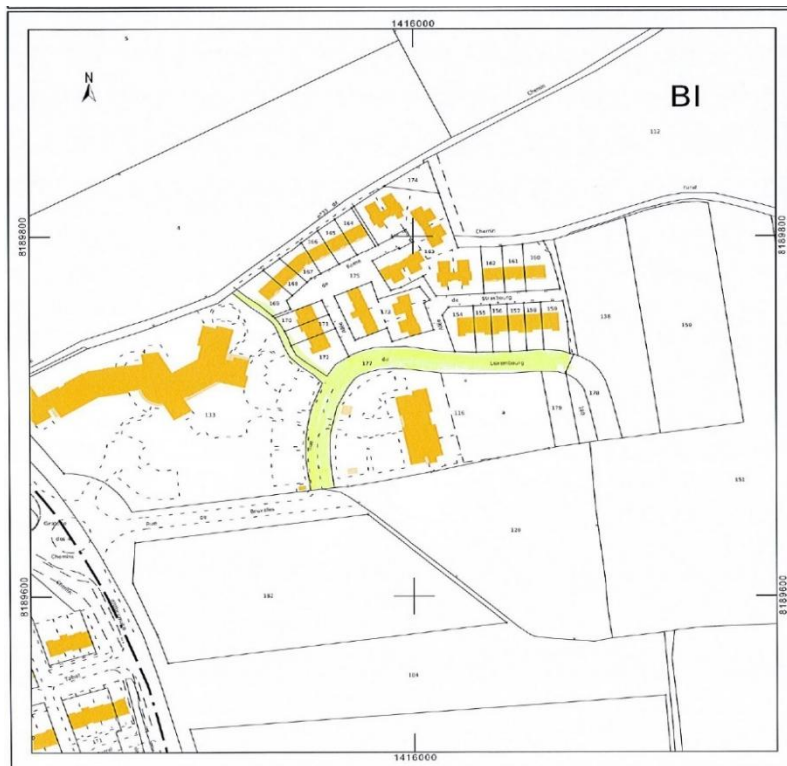
Figure 2 - La parcelle BI 177 à rétrocéder à la commune

A ces 3 parcelles, s'ajoute également la parcelle cadastrée BI 177 (2 399 m 2 ) correspondant à l'emprise restante de la rue du Luxembourg, également matérialisée en jaune sur la cartographie ci-après.